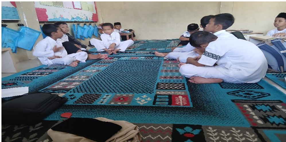
Gambar 4 8 Dzikir pagi

Berdasarkan observasi, setelah melaksanakan sholat dhuha berjama'ah maka para siswa pun melaksanakan dzikir pagi bersama, hal ini bertujuan untuk memberikan kebiasaan kepada siswa untuk terus mengingat Allah S.W.T setiap waktu. Dengan melaksanakan dzikir pagi sebelum belajar diharapkan dapat memberikan keberkahan kepada ilmu yang akan dipelajari oleh para siswa dan dengan dzikir pagi diharapkan mampu memberikan kemaksimalan hasil bagi siswa dalam menuntut ilmu melalui pembibingan akhlak terpuji ini, diharapkan dapat memberikan keberkahan bagi siswa dalam memulai aktivitas harian mereka.