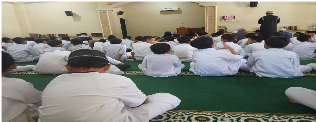
Gambar 4 10 Persiapan sholat Jum'at

Berdasarkan observasi, selain sholat dzuhur. Ketika hari Jum'at tiba para siswa diwajibkan mengikuti sholat secara Jum'at berjamaah di Masjid Islamic Center Ponorogo, hal ini untuk memberikan kebiasaan bagi para siswa untuk mengerjakan sholat wajib Jum'at pada waktunya. Selain itu, sholat Jum'at memiliki keutamaan yang membuat wajib untuk dilaksanakan khususnya bagi laki-laki, maka madrasah mewajibkan para siswa untuk melaksanakan sholat Jum'at di masjid Islamic Center Ponorogo untuk memastikan dan membiasakan para siswa melaksanakan sholat Jum'at setiap hari Jum'at.