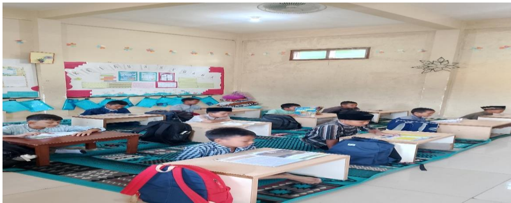
Gambar 4 2 Kegiatan Literasi Siswa Kelas Tiga

Madrasah juga memberikan upaya dalam meningkatkan akhlak terpuji siswa melalui beberapa program yang terus diulang setiap minggunya, seperti misalnya pada hari selasa para siswa diwajibkan untuk sebelum memulai kegiatan tahfidznya, literasi dengan membaca kisah-kisah para sahabat, hal ini bertujuan agar siswa menjadikan tauladan dan mengamalkan perbuatan para sahabat-sahabat Rasulullah S.A.W, hal ini bertujuan agar para siswa dapat meningkatkan karakternya menjadi lebih baik dan sesuai yang dicontohkan, maka adanya kegiatan literasi yang selalu dilaksanakan secara rutin setiap hari selasa.