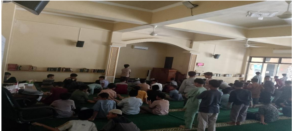
Gambar 4 9 Persiapan sholat Dzuhur

Berdasarkan observasi, selain sholat dzuhur. Ketika hari Jum'at tiba para siswa diwajibkan mengikuti sholat secara Jum'at berjamaah di Masjid Islamic Center Ponorogo, hal ini untuk memberikan kebiasaan bagi para siswa untuk mengerjakan sholat wajib Jum'at pada waktunya. Selain itu, sholat Jum'at memiliki keutamaan yang membuat wajib untuk dilaksanakan khususnya bagi laki-laki, maka madrasah mewajibkan para siswa untuk melaksanakan sholat Jum'at di masjid Islamic Center Ponorogo untuk memastikan dan membiasakan para siswa melaksanakan sholat Jum'at setiap hari Jum'at.