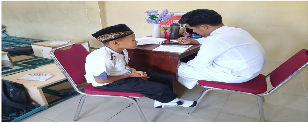
Gambar 4 6 siswa menyetorkan hafalan

Berdasarkan hasil observasi, kemudian setelah para siswa menyetorkan hafalannya, mereka pun diperintahkan guru pendidikan agama Islam untuk segera mengambil air wudhu di luar, kemudian jika sudah selesai maka kembali ke kelas untuk melaksanakan sholat dhuhaberja'mah. Ketika para siswa hendak wudhu mereka mengambil air wudhunya secara berurutan sesuai dengan yang menyetorkan hafalan lebih dulu dan bergantian setiap tiga orang pertama, misalnya yang menyelesaikan pertama hingga ketiga, kemudian seterusnya hingga selesai di mana para siswa telah selesai mengambil air wudhu semuanya. Hal ini sejalan dengan apa yang disampaikan oleh Ustadz Ammirul bahwa: