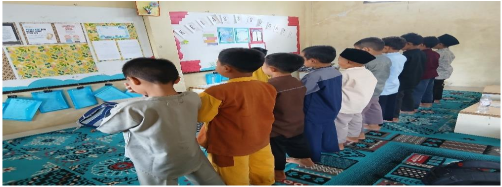
Gambar 4 1 Pembiasaan Sholat Dhuha Berjamaah Siswa Kelas Tiga

Hal ini sesuai dengan perkataan Ustadz Ammirul bahwa: