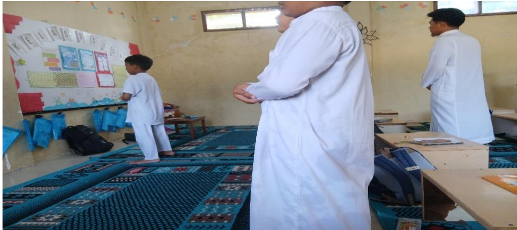
Gambar 4 7 sholat dhuha berjama'ah dan diawasi oleh Ustadz

Berdasarkan observasi, setelah melaksanakan sholat dhuha berjama'ah maka para siswa pun melaksanakan dzikir pagi bersama, hal ini bertujuan untuk memberikan kebiasaan kepada siswa untuk terus mengingat Allah S.W.T setiap waktu. Dengan melaksanakan dzikir pagi sebelum belajar diharapkan dapat memberikan keberkahan kepada ilmu yang akan dipelajari oleh para siswa dan dengan dzikir pagi diharapkan mampu memberikan kemaksimalan hasil bagi siswa dalam menuntut ilmu melalui pembibingan akhlak terpuji ini, diharapkan dapat memberikan keberkahan bagi siswa dalam memulai aktivitas harian mereka.