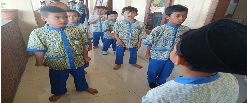
Gambar 4 4 Para Siswa berdiri di Depan Kelas Sebelum Memasuki Kelas

Berdasarkan hasil observasi, dapat dijelaskan bahwa guru PAI sangat berperan penting dalam menjamin dan memastikan terlaksananya pembiasaan tersebut secara konsisten, karena para siswa kelas 3(tiga) yang masih berada pada fase anak-anak belum mampu untuk melaksanakan berbagai kegiatan secara mandiri tanpa adanya arahan dan bimbingan dari guru PAI. Selain guru PAI, kepala sekolah MI Alam Islamic Center Ponorogo juga terlibat dalam berkontribusi terkait peningkatan akhlak terpuji bagi siswa yaitu dengan mengajak tiga lapisan yang bersifat penting seperti guru, masyarakat dan orang tua murid untuk terlibat dalam memberikan dukungan, perhatian dan bimbingan kepada para siswa, agar mereka selalu menerapkan akhlak terpuji baik di madrasah, lingkungan masyarakat dan di rumah saat bersama dengan keluarga. Hal ini sesuai dengan apa yang dikatakan oleh Kepala Madrasah Ustadz Sumarno: