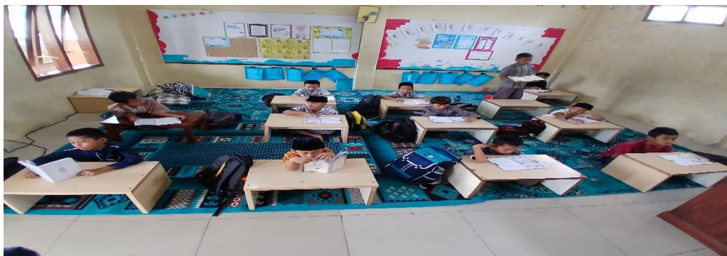
Gambar 4 3 Kegiatan Membaca dan Menghafal Al-Qur’an Siswa Kelas Tiga

“betul, jadi setiap hari siswa diwajibkan untuk berbaris di depan kelas sebelum memasuki kelas, mereka kami berikan beberapa pertanyaan mudah kalo mereka bisa menjawab, maka kami persilahkan masuk lalu setelah mereka masuk semua, maka diteruskan dengan tahfidz membaca dan menghafal Al-Qur’an”.