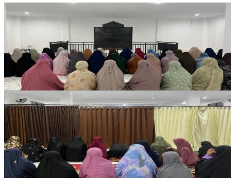
Gambar 4.5 Shalat Jamaah