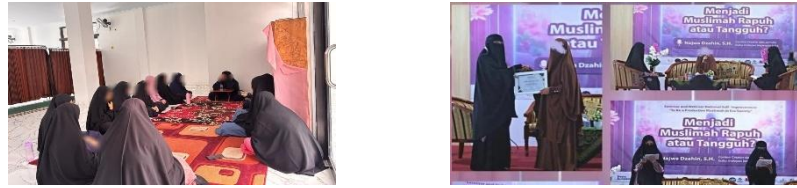
Gambar 4 9 Pengalaman Spiritual Mahasiswi Motherless melalui kegiatan-kegiatan berupa Ta'lim, Halaqah, Pembinaan, Shalat Jamaah, perkuliahan dengan matkul Diniyyah yang mendukung kedekatan kepada Allah serta ketenangan batin.