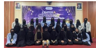
Gambar 4 .11 Aktivitas organisasi, perkuliahan, dan mengajar ngaji sebagai bentuk perubahan perilaku mahasiswa motherless dalam menghargai kehidupan, bersyukur, dan berusaha memperbaiki diri.