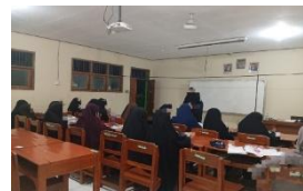
Gambar 4. 10 Kegiatan Pembelajaran I'dad, dan Perkuliahan sebagai sarana peningkatan pemahaman keagamaan dalam memaknai sabar, tawakal, dan hikmah ujian.