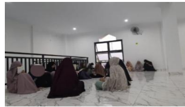
Gambar 4.2 Halaqah