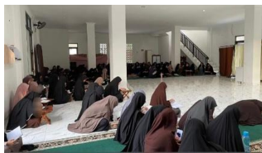
Gambar 4.1 Kegiatan Ta'lim Pekan

Berbagai kegiatan tersebut sejalan dengan visi STIT Madani Yogyakarta untuk menjadi perguruan tinggi berbasis pesantren yang unggul dalam pengembangan keilmuan Islam dengan landasan nilai Ahlussunnah wal Jama'ah. Selain itu, kegiatan-kegiatan pembinaan spiritual juga mendukung pencapaian misi dan tujuan institusi, khususnya dalam mewujudkan penghayatan dan pengamalan nilai-nilai Islam, pembentukan karakter Islami, serta pengembangan sumber daya manusia yang berakhlak mulia dan berwawasan global. Oleh karena itu, lingkungan akademik dan religius yang terdapat di STIT Madani Yogyakarta menjadi salah satu faktor yang mendukung terbentuknya spiritualitas mahasiswa, termasuk mahasiswi motherless yang menjadi fokus dalam penelitian ini.