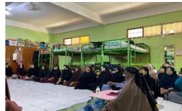
Gambar 4 4 Pembinaan setiap bulan