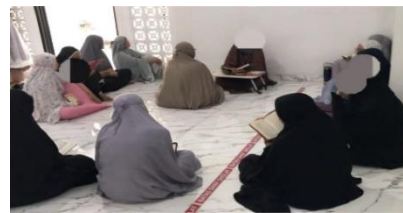
Gambar 4.7 Kegiatan Ta'lim dan Halaqah Mahasiswi STIT Madani Yogyakarta sebagai sarana penguatan pemahaman keagamaan dan keyakinan terhadap takdir Allah.