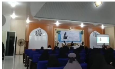
Gambar 4. 3 Seminar