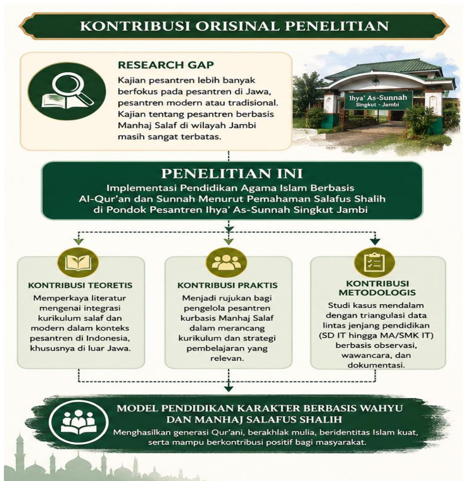
Gambar 1 Kontribusi Orisinal

Model tersebut menunjukkan bahwa pendidikan berbasis manhaj salaf tidak hanya berorientasi pada penguasaan ilmu agama, tetapi juga mampu membentuk karakter santri yang berakidah lurus, beradab, disiplin, dan siap berkontribusi positif di tengah masyarakat.