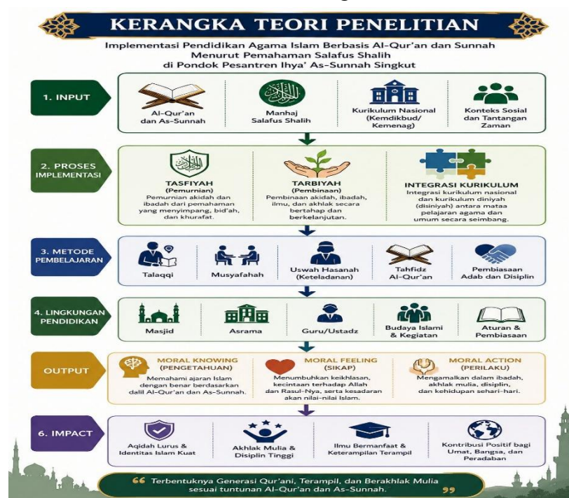
Gambar 2 Kerangka Teori

Berdasarkan uraian tersebut, kerangka teori penelitian ini menggambarkan hubungan yang sistematis antara masukan, proses, konteks, keluaran, dan dampak dalam implementasi kurikulum berbasis wahyu untuk membentuk karakter santri di era modern.