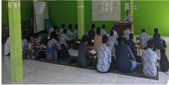
Gambar 6.2 Gambar Pembelajaran di Kelas

perbandingan tersebut bersifat negatif, maka dapat berdampak pada menurunnya self esteem .