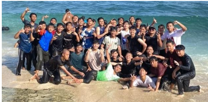
Gambar 6.3 Gambar Kegiatan Rihlah Santri

Namun, dalam konteks teori pergaulan teman sebaya, interaksi yang intens dalam kegiatan seperti ini juga dapat memunculkan konformitas. Individu cenderung menyesuaikan diri dengan norma kelompok agar diterima. Jika konformitas terjadi secara berlebihan, maka dapat menghambat perkembangan kemandirian dan keaslian diri ( authentic self ), yang merupakan bagian penting dari self esteem .