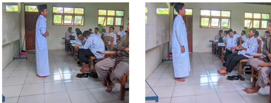
Gambar 6.1 Gambar Belajar Malam Santri

Namun demikian, dokumentasi juga mengindikasikan adanya kedekatan yang tinggi antar anggota kelompok tertentu, yang berpotensi menimbulkan ketergantungan. Dalam perspektif teori self esteem , ketergantungan yang berlebihan dapat menghambat terbentuknya kemandirian psikologis, yang merupakan salah satu indikator self esteem yang sehat.