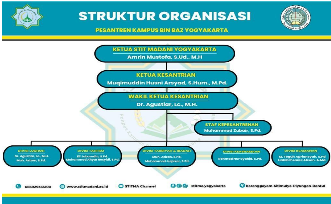
Gambar 4.0.2 Struktur Organisasi Pesantren Sekolah Tinggi Ilmu Tarbiyah