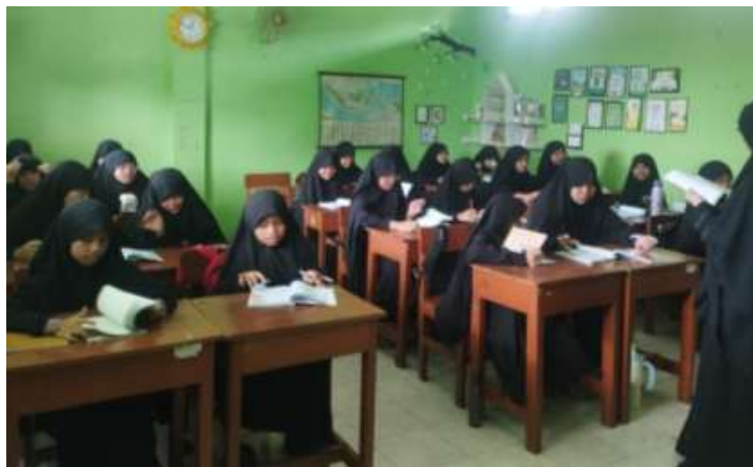
Gambar 8 Suasana Pembelajaran di Kelas

“Lebih mudah memahami, misalnya kalau ada yang gak paham disuruh angkat tangan, nanti dijelasin lagi”.