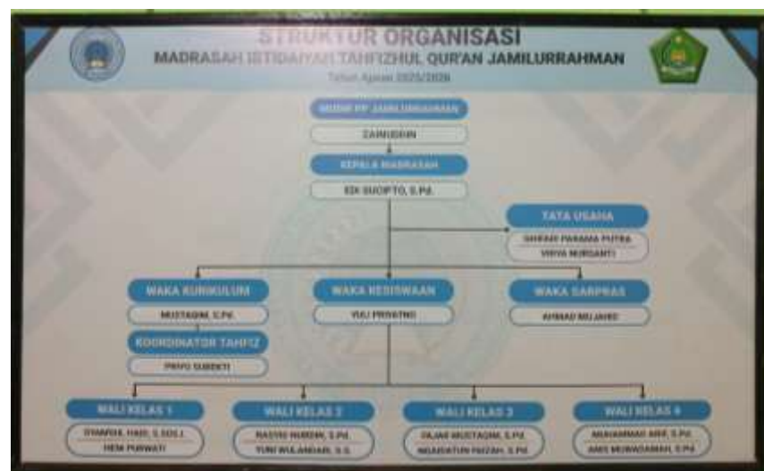
Gambar 2 Struktur Organisasi MITQ Jamilurrahman

Berikut ini disajikan gambar struktur organisasi Madrasah Ibtidaiyah Tahfidzul Qur'an Jamilurrahman. Namun demikian, struktur organisasi tersebut masih terdapat beberapa penyesuaian yang belum sepenuhnya tergambarkan dalam bagan, khususnya terkait perubahan pada bagian Tata Usaha (TU) yang dijabat oleh Ustadzah Vidya, serta pencantuman gelar akademik S.Pd pada jabatan Wakil Kepala Madrasah Bidang Kurikulum dan Koordinator Tahfidz. Penyesuaian ini disesuaikan dengan kondisi aktual di madrasah pada saat penelitian berlangsung.