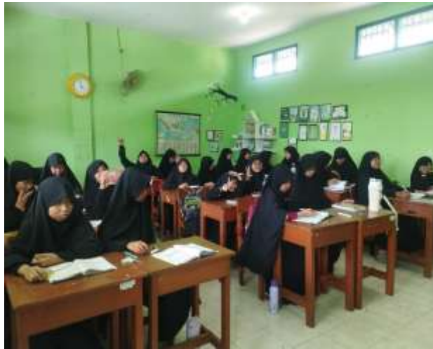
Gambar 5 Tanya Jawab di Kelas

Penggunaan metode tanya jawab dalam pembelajaran Fikih tersebut sejalan dengan teori konstruktivisme yang dikemukakan oleh Jean Piaget, yang menekankan bahwa pembelajaran akan lebih efektif apabila siswa terlibat secara aktif dalam membangun pengetahuannya sendiri. Melalui metode tanya jawab, siswa tidak hanya menerima informasi dari guru, tetapi juga didorong untuk berpikir, menjawab pertanyaan, serta mengaitkan materi dengan pengalaman yang dimiliki. Hal ini terlihat dari keterlibatan siswa dalam menjawab pertanyaan yang diajukan guru, sehingga proses pembelajaran menjadi lebih bermakna.