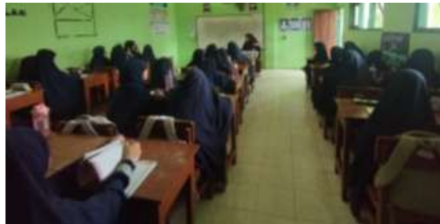
Gambar 7 Suasana Pembelajaran di Kelas

“Cara jelasin, kadang saya buka dengan cerita supaya tahu apa yang mereka rasakan, saya dengarkan dulu. Biasanya saya juga melakukan metode main game sebelum belajar, kadang saya nyari gambar atau hal-hal menarik, supaya mereka tidak melulu belajar dengan metode ceramah saja”.