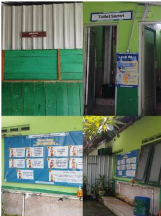
3. Dokumentasi Pojok Baca