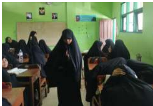
Gambar 9 Pengendalian Perilaku Siswi

“Kalau rame atau nggak fokus, biasanya ditegur, kayak eh fokus dulu, nanti istirahat”.