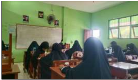
Gambar 6 Suasana Pembelajaran di Kelas

Penggunaan metode cerita dalam pembelajaran Fikih tersebut sejalan dengan teori belajar sosial yang dikemukakan oleh Albert Bandura, yang menyatakan bahwa individu belajar melalui proses meniru ( modeling ) dari apa yang dilihat dan didengar. Dalam hal ini, cerita yang disampaikan guru mengandung nilai-nilai akhlak dan contoh perilaku yang dapat diteladani oleh siswa. Melalui cerita tersebut, siswa tidak hanya memahami materi secara kognitif, tetapi juga terdorong untuk meniru dan menerapkan perilaku yang baik dalam kehidupan sehari-hari.