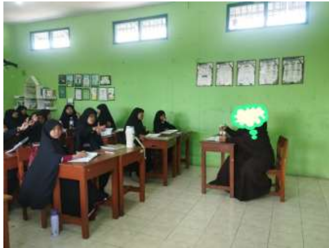
Gambar 3 Guru Menyampaikan Tujuan Pembelajaran

Berdasarkan hasil observasi yang dilakukan oleh peneliti, terlihat bahwa guru Fikih menyampaikan tujuan pembelajaran dengan menggunakan bahasa yang sederhana dan mudah dipahami oleh siswa. Dalam menyampaikan tujuan pembelajaran, guru tidak hanya menyebutkannya secara formal, tetapi juga mengaitkannya dengan praktik ibadah dan pengalaman sehari-hari siswa, khususnya yang berkaitan dengan tata cara shalat dan alasan mengapa shalat wajib dilaksanakan.