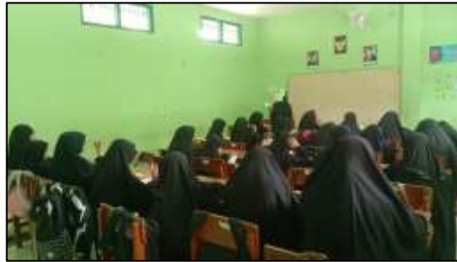
Gambar 4 Suasana Pembelajaran di Kelas

“Saya menggunakan metode ceramah untuk menjelaskan dasar-dasar Fikih terlebih dahulu, supaya anak-anak paham konsepnya. Tapi penyampaiannya saya buat sederhana dan saya hubungkan dengan kegiatan sehari-hari mereka, misalnya shalat, supaya tidak hanya tahu teorinya saja”.