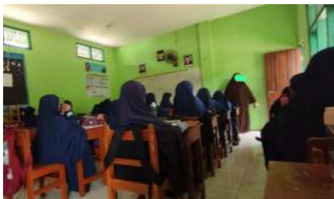
Gambar 10 Suasana Pembelajaran di Kelas

“Ustazah sering ngasih motivasi, kayak disuruh tetap semangat, jangan menyerah, dan semangat belajar” .