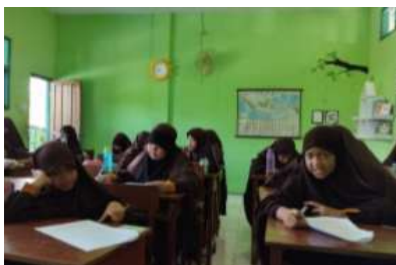
Gambar 12 Ujian Semester

“Kalau untuk praktik sehari-harinya kita bisa bilang belum 100 persen seperti yang kita mau, karena kita punya target. Mungkin belum sepenuhnya terpenuhi oleh mereka. Tapi kalau dari segi akademisnya nilainya sudah sangat baik, jadi alhamdulillah. Kemarin juga bahkan anak, terutama di kelas 5B, nilainya paling bawah pun tidak remedial. Kalau dari segi akademisnya cukup meningkat, dengan metode pembelajaran yang diberikan ini”.